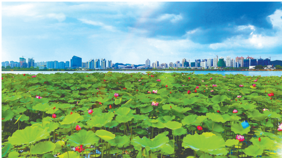
遂宁圣莲岛世界荷花博览园。