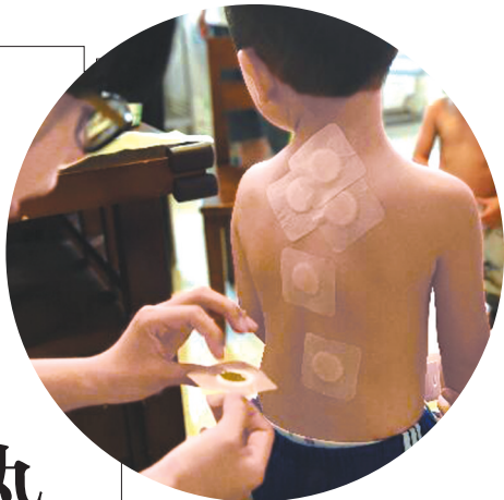
进入伏天，医生为一名小朋友贴“三伏贴”。