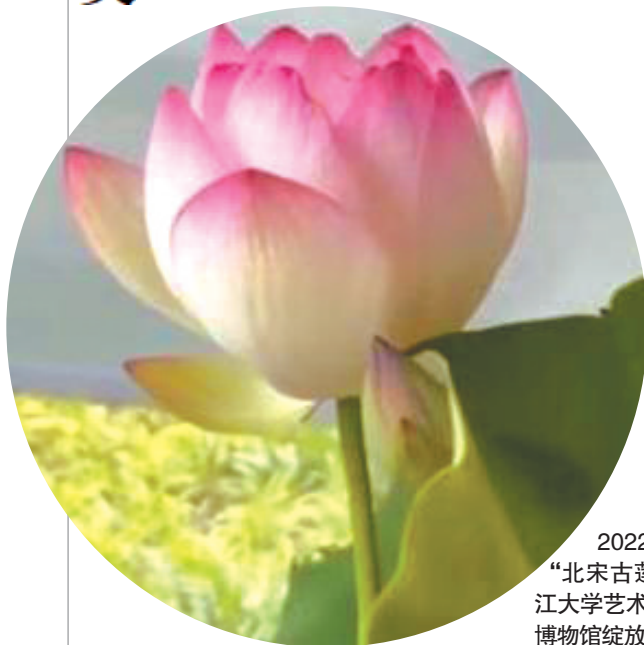
2022年6月，“北宋古莲”在浙江大学艺术和考古博物馆绽放。

古人写“接天莲叶无穷碧，映日荷花别样红”，今人唱“游过了四季，荷花依然香，等你宛在水中央”。从屈原在《离骚》中写“制芰荷以为衣兮，集芙蓉以为裳”，到周敦颐的《爱莲说》，再到如今“相亲相爱一家人”群中，长辈们人手一个的微信头像。荷，你说它大雅也好，大俗也罢，它已经实实在在地与中国人打了上千年的交道。