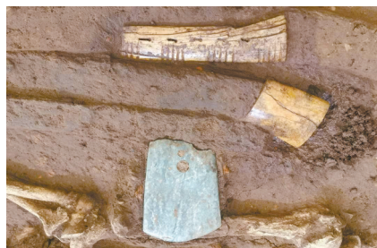
▲黄山遗址M77大墓陪葬品。

然河、人工河道、环壕一起构成了水路交通系统,体现出古人对水资源的重视和利用能力。