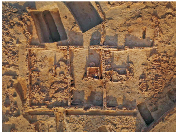
▲仰韶晚期坊居F2航拍图。