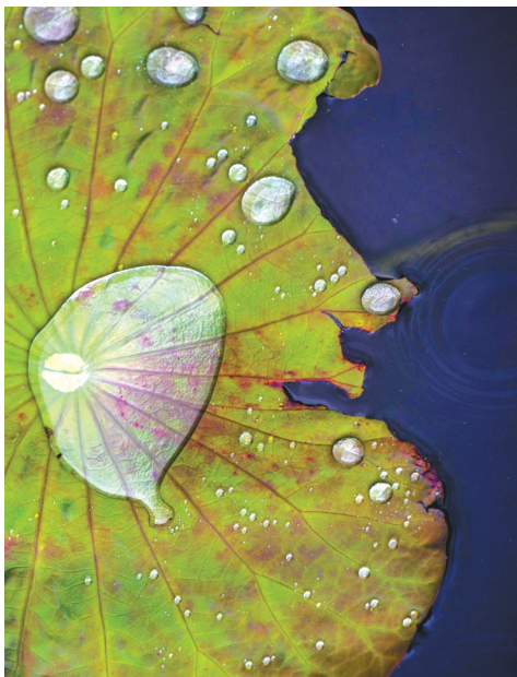
进入7月，在贵州省黔东南苗族侗族自治州从江县，荷叶上布满水珠。

在不少古代文豪所留下的诗篇中，都能看到对于三伏炎热的描述。譬如，唐代诗人刘禹锡，就写过“金数已三伏，火星正西流”。同时，白居易也写过“是时三伏天，天气热如汤”，可见此时的高温酷暑，让诗人们经受不住。