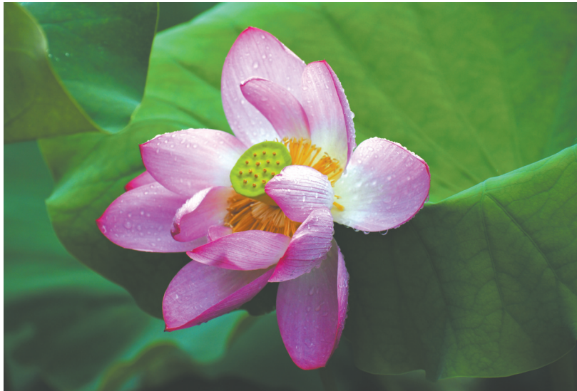
盛夏时节，山东枣庄山亭区月亮湾国家湿地公园内的荷花盛放。

一说到闷热潮湿又漫长的“三伏天”，估计大多数人都会脸色一变，想起那灼热逼人的暑气。7月16日，三伏天中的“初伏”将伴随着高温来临。接下来，是长达40天的“三伏”。