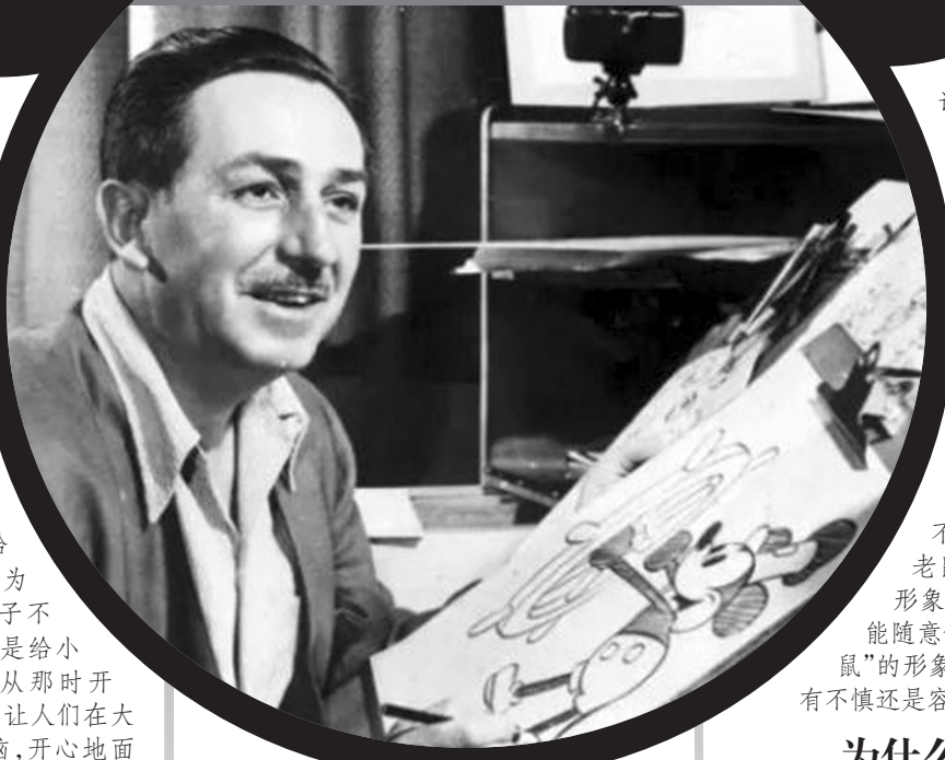
华特·迪士尼和米老鼠

根据2003年美国财经杂志《福布斯》推出的“虚构形象富豪榜”,最能挣钱的卡通富翁就是米老鼠和它的朋友们,价值58亿美元。