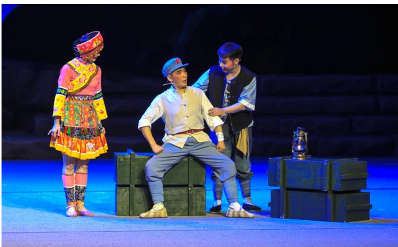
《赤水河畔》演出剧照。

作为四川艺术基金(重点项目)2021年度资助项目，《赤水河畔》在遵循川剧的艺术风格特色基础上，融入国家级非遗古蔺花灯和苗族歌舞等泸州特色非遗元素，运用符合当代审美的现代舞美技巧，将红色文化与舞台艺术完美结合。此次来成都演出，该剧以“川剧名家+本土艺术力量+新