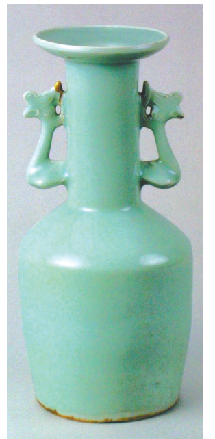
青瓷双耳瓶(龙泉窑)

从北宋末年开始，宋朝开始在都城设置了官窑。北宋汴京(今河南开封)的官窑窑址目前尚未找到，而南宋临安(今浙江杭州)的两个官窑窑址已经发现。与汝瓷比较，官窑作品虽然在胎釉两方面都有变化，但是艺术追求全然相同。造型古雅，器表无装饰，开片依然存在，釉质依然如玉。汝瓷如玉，主要依靠玛瑙做釉，但在靖康之变后，汝州