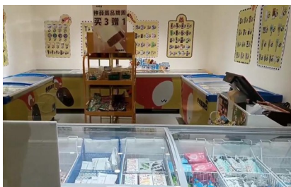
成都一零售店内，雪糕品种繁多。

据天眼查数据显示，我国目前有近4.5万家雪糕相关企业，今年以来已新增3000余家雪糕相关企业。此外，随着