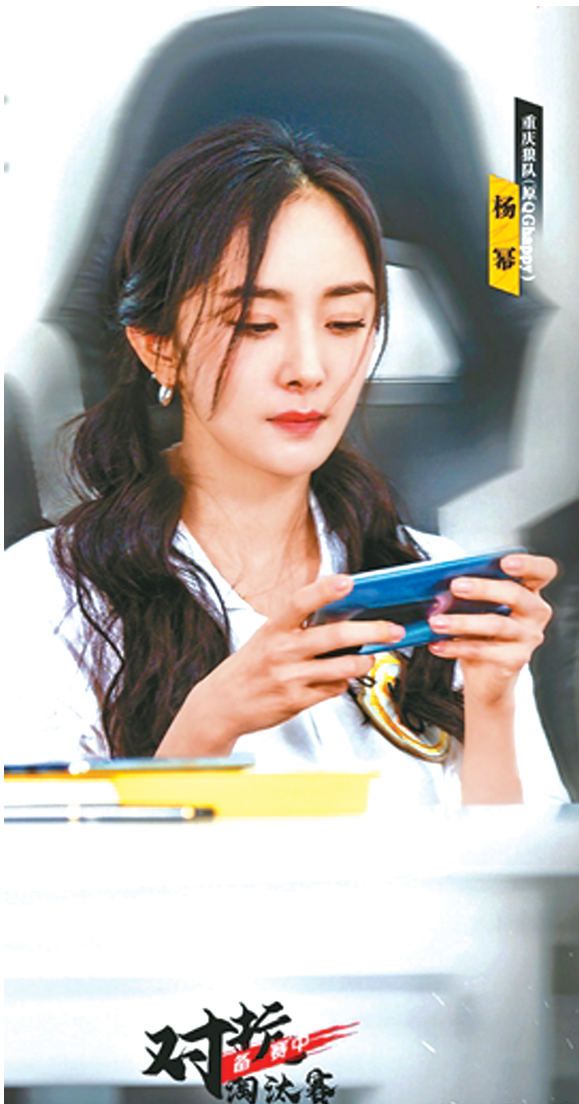
杨幂喜爱电竞类游戏。