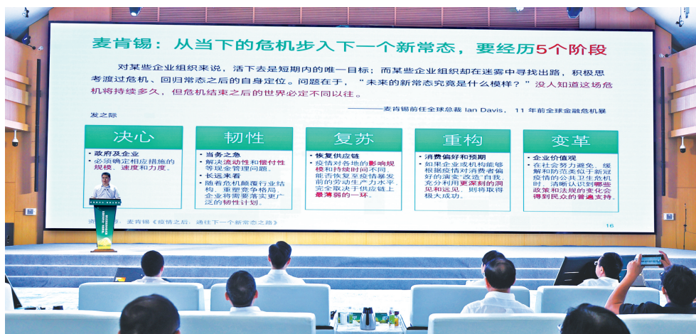
6月27日，新津区召开建圈强链高质量发展大会。

与此同时，不断提升对企业的服务质量。成都建立外企走访制度、设立外企服务专员、定期召开座谈会、开展监测分析等，为企业在蓉发展提供专业化、全流程、全生命周期服务，帮助企业协调政策落实、解决发展难题，促进企业增资扩能。