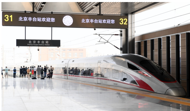
▲这是6月20日拍摄的北京丰台站。