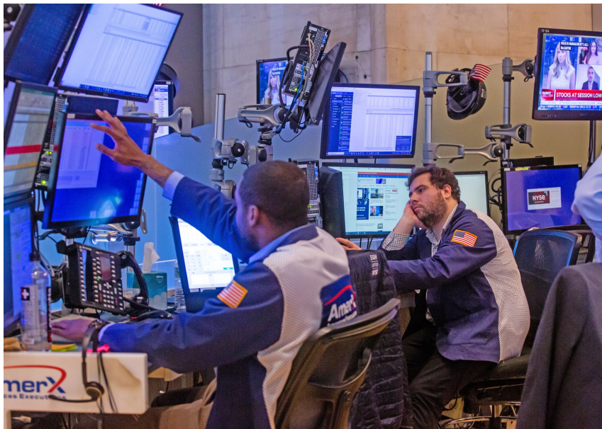
6月13日,交易员在美国纽约证券交易所工作。

根大通和高盛集团的市场研究人员均预计美联储将在 15 日宣布加息 75 个基点。