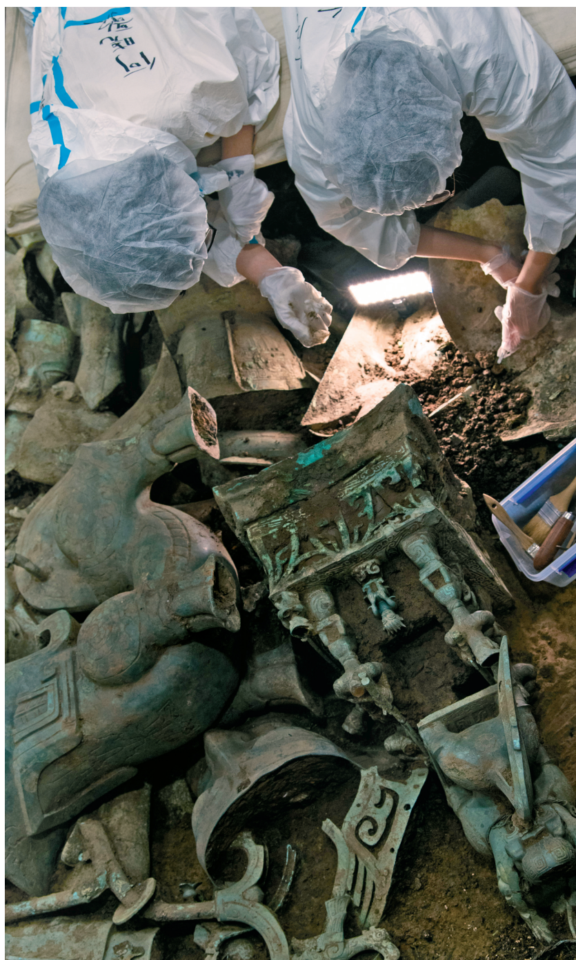
在三星堆遗址8号“祭祀坑”，考古队员在进行挖掘工作(5月31日摄)。