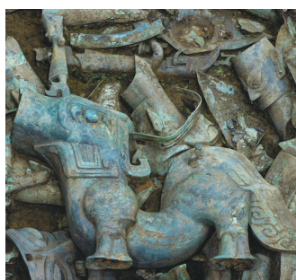
这是在8号“祭祀坑”拍摄的铜巨型神兽(6月1日摄)。