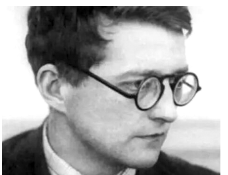
青年时代的肖斯塔科维奇