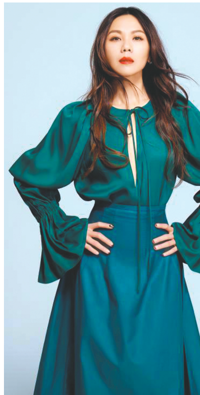
华语流行乐女歌手蔡健雅