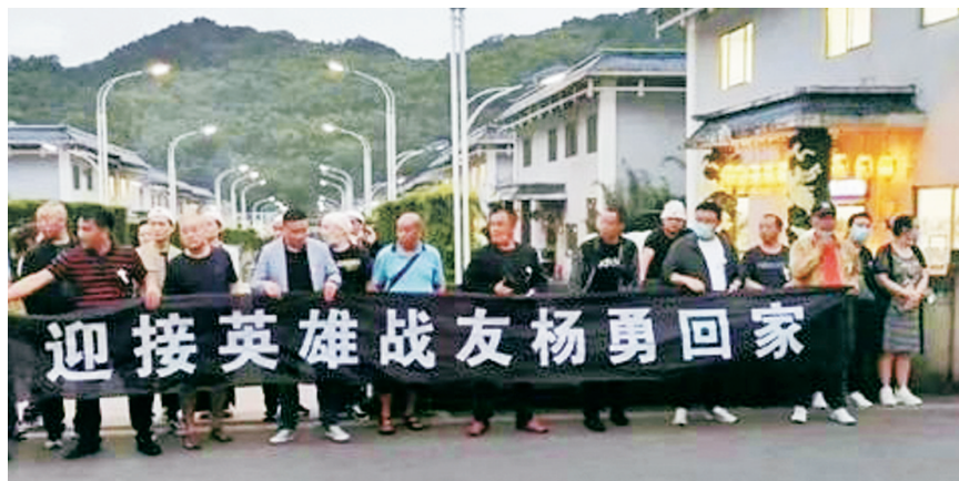
6月5日，运送杨勇遗体的车队回到他的家乡贵州遵义，他生前的战友们从四面八方赶来，送他最后一程。