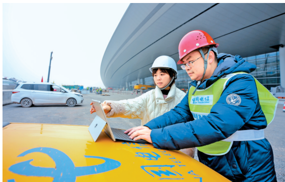
四川电信助力成都天府国际机场建成智慧机场。