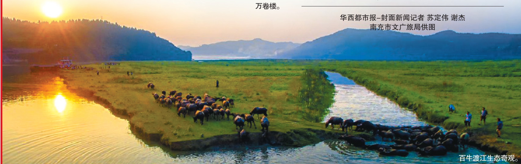
百牛渡江生态奇观。