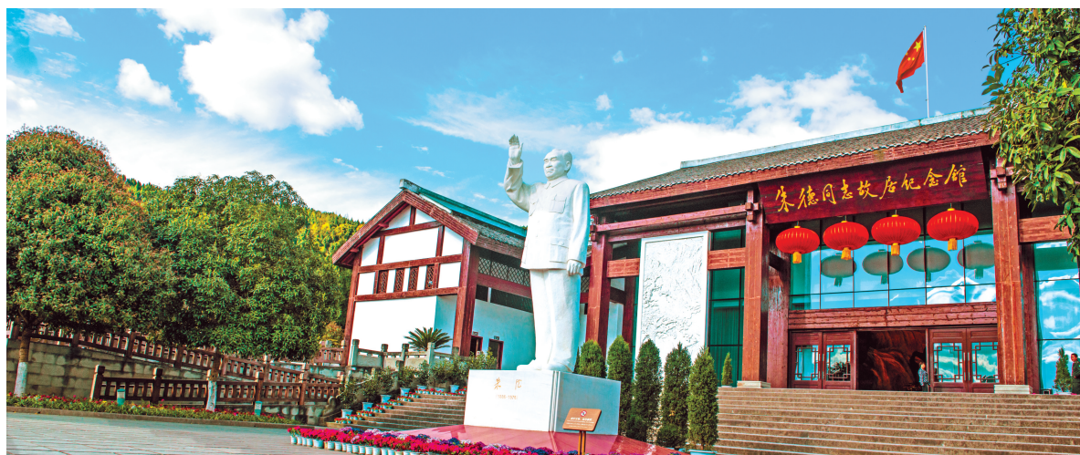
朱德同志故居纪念馆。

2018年到2020年，每年春节，全球华人圈“年味最浓、舞台最大、时间最长、传承最广”的春节文化盛宴，都在春节文化之源阆中上演。打造全国唯一的春节文化主题公园，恢复南津关古镇，阆中水城、阆中赛城等重大文旅项目落地。王皮影成功申报为国家级非物质文化遗产，民俗舞蹈《亮花鞋》压轴亮相央视春晚。