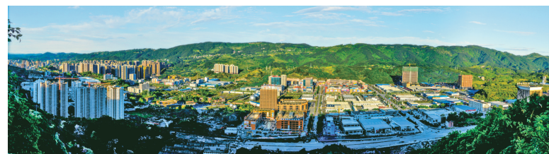
达州市达川区商贸物流园区。