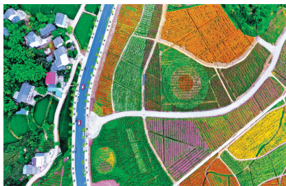
达川区乡村旅游景点——中华银杏谷。

品牌最齐、规模最大的家居市场,五金机电园是川渝陕结合部规模最大、设施最先进、功能最齐全的第三代专业市场。全市唯一的智慧物流总部基地正加快建设,全区规上物流企业数、国家3A级物流企业数、全年快递业务量和投递量居全市第一,入选全省三级物流体系建设重点县名单。