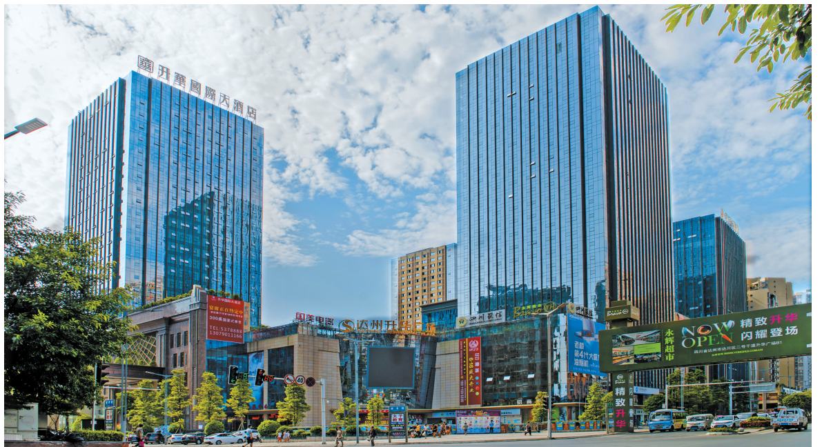
达州市升华广场商圈一角。

杨柳商贸集聚区是全省首批、达州市唯一的“省级现代服务业集聚区”。其中,汽贸园是川东北最大的汽贸基地,家居建材园是川东北