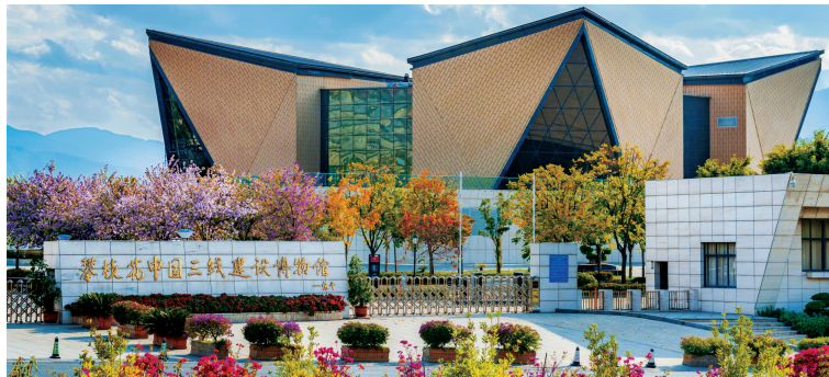
攀枝花中国三线建设博物馆。