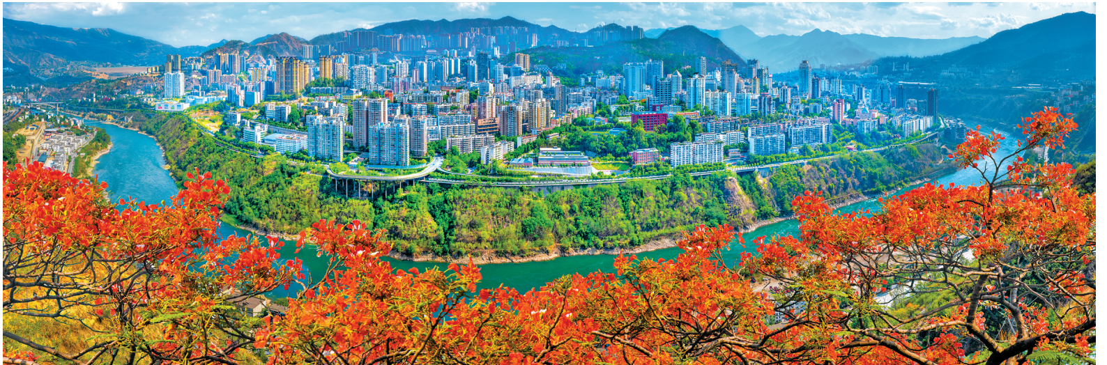
攀枝花城区一角。