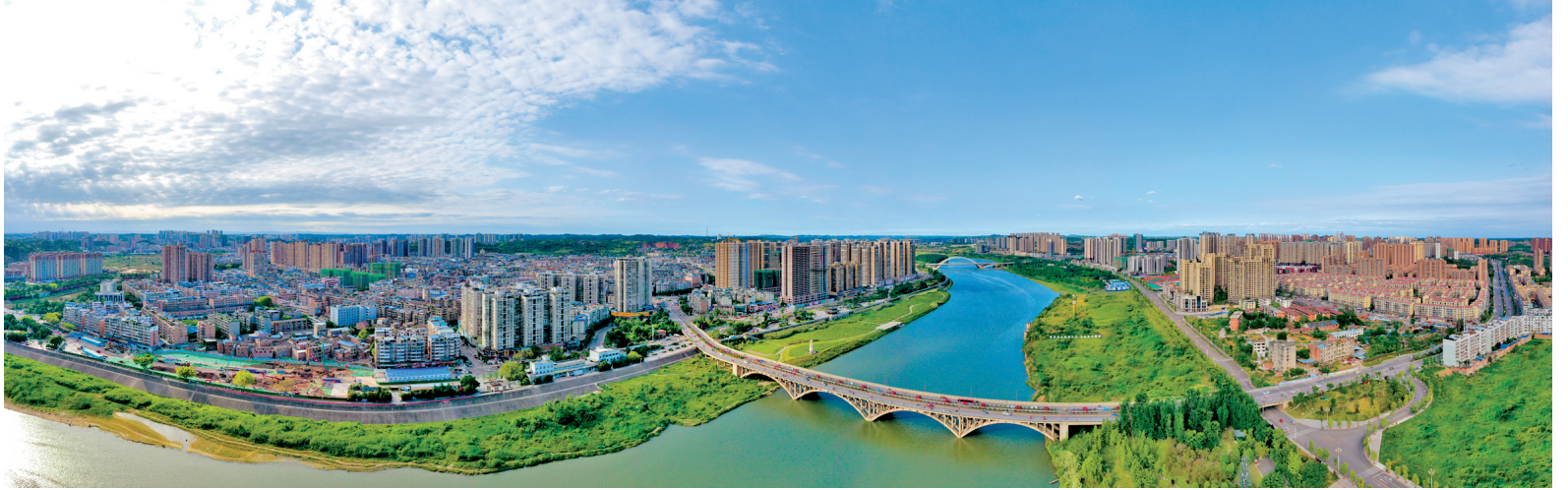
雁江加快建设成资同城化创新发展先行区。