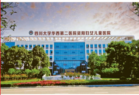
由四川大学华西第二医院领办的资阳妇女儿童医院(雁江区妇幼保健院)。