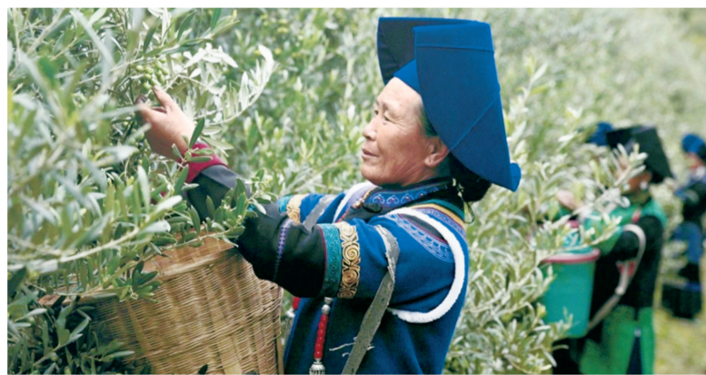
当地村民参与橄榄种植。