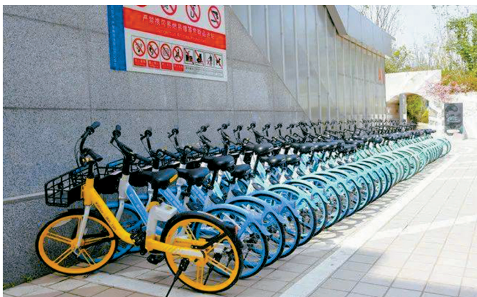
龙泉驿界牌地铁站外，共享单车整齐排列在停车区域内。

说，就是利用卫星定位技术给共享单车指定停放区域划定一个虚拟“围栏”，使用者只有将单车停放到“围栏”内，才能完成锁车支付。违规停放在“电子围栏”外的用户，将被禁止锁车结算，手机APP端将持续计价，并会收到系统发出的规范停车提醒。