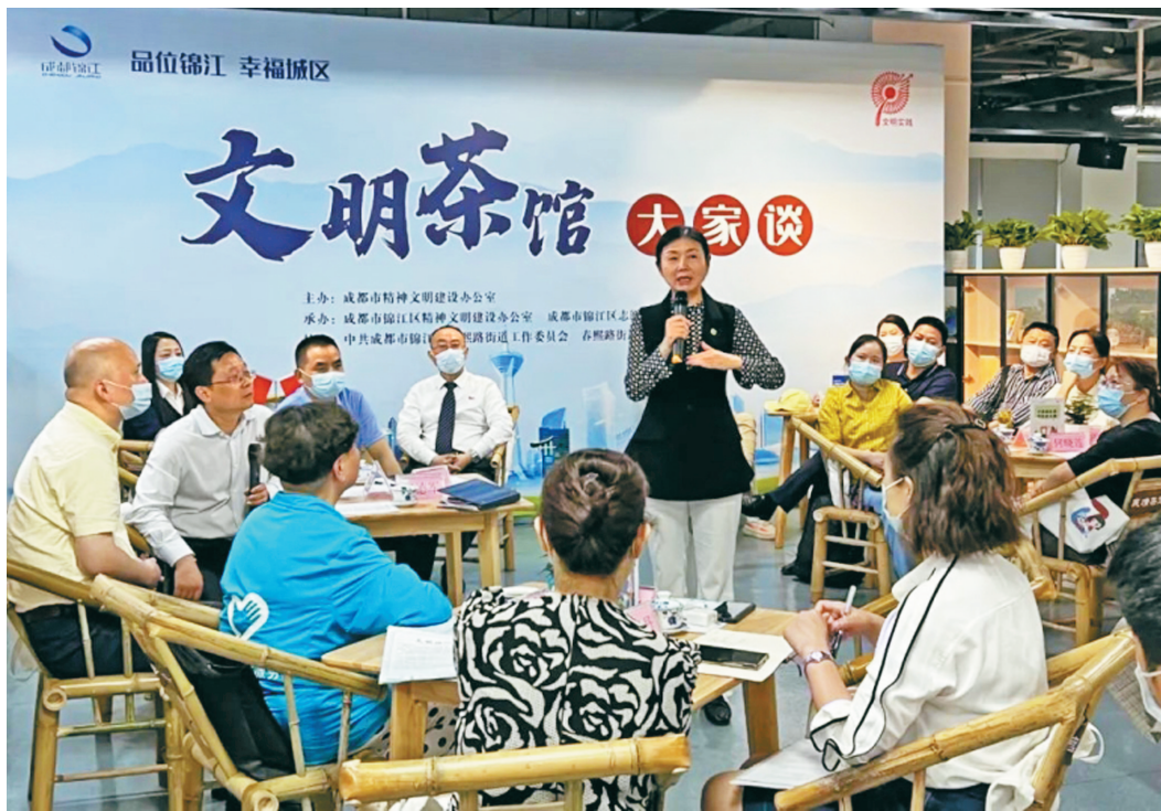
成都开展“文明茶馆大家谈”活动。

今年3月以来，成都市龙泉驿区聚焦共享单车“停车乱、停车难”等问题，探索推行共享单车“电子围栏”功能，精细精准做好共享单车监管。具体来