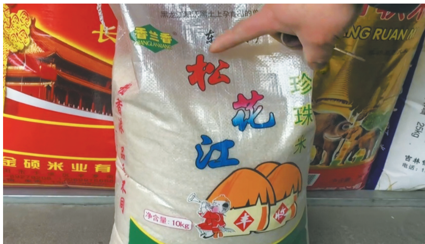
“松花江”大米原包装。

此外，华西都市报、封面新闻记者还了解到，正大桑田公司起诉的黑龙江红兴隆农垦格林粮食经销有限公司(以下简称红兴隆公司)的“松花江大米案”一审，已于5月10日在西安判决，法院驳回了正大桑田公司的全部诉讼请求。