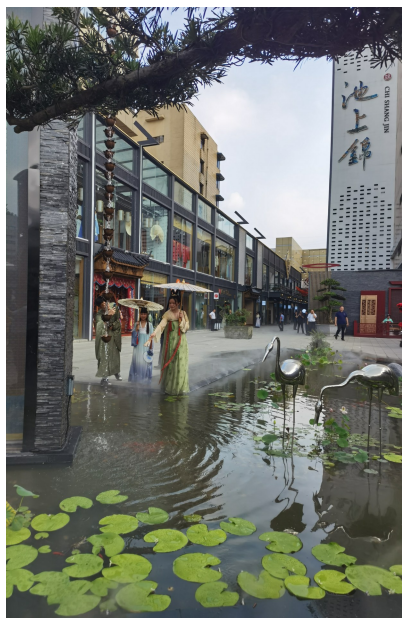
池上锦文化创意街。