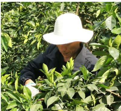
莫色尔布在脐橙园伺弄他的果树。