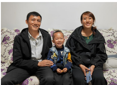
莫色尔布幸福的一家。

下的人还要好。只是后来,社会经济发展了,悬崖村因为交通不便,被时代远远甩在了后面。