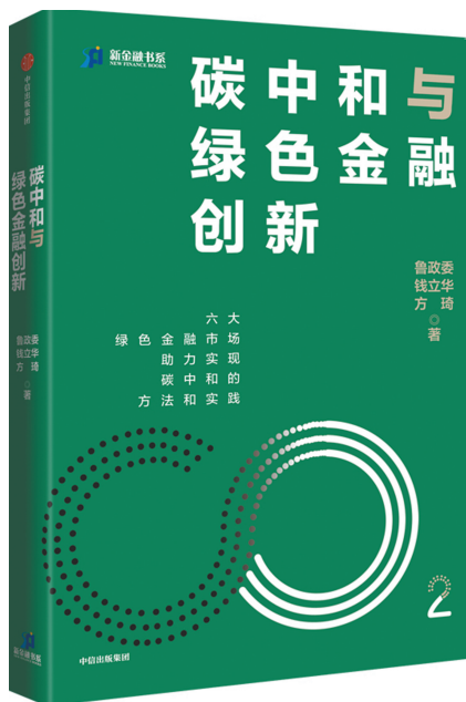
《碳中和与绿色金融创新》