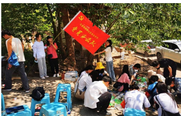
▲玉皇观农村社区党员活动。