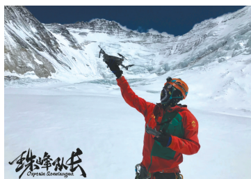
在攀登珠峰的过程中进行航拍。