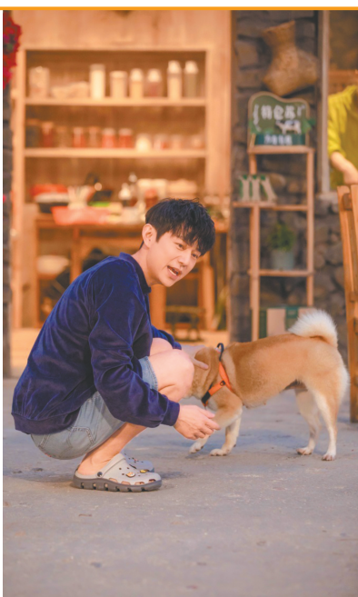
《向往的生活》第六季治愈回归。

鱼、近岸赶海，每解锁一种海洋生物，就算完成一项任务；一部分是关于村庄的解锁，成员们可学习烹饪东山羊、文昌鸡、和乐蟹、嘉积鸭等当地特色美食，体验参与防护林巡逻等当地活动。解锁完成获得“宝贝（宝螺）”，可在海上流动超市“鲨鱼号”消费，还能解锁“神秘挂件”，例如有趣的房子、神奇的车子等，这些“神秘挂件”将让大家的海边生活更加梦幻。