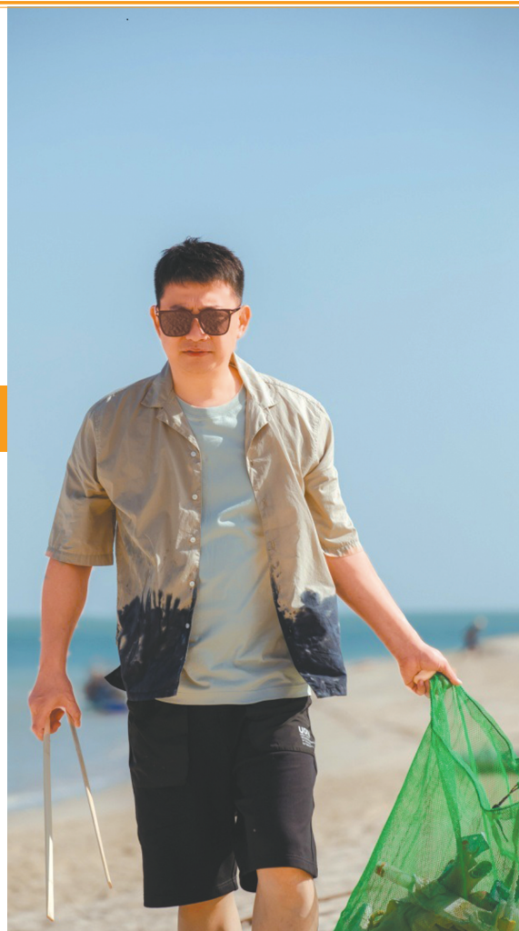
蘑菇屋家人们收拾海岸垃圾。