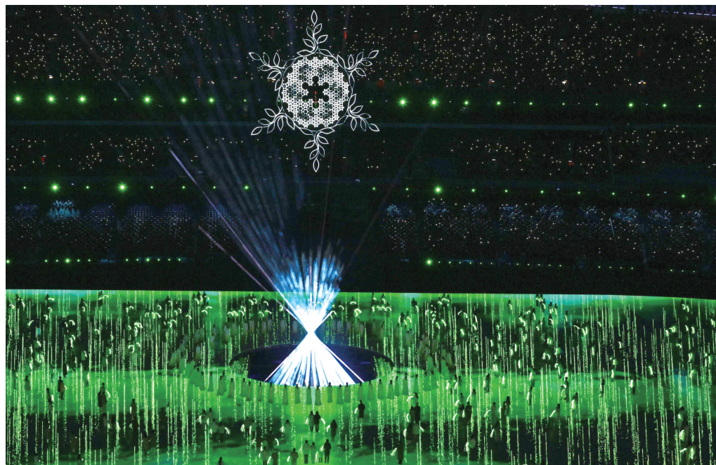
北京冬奥会闭幕式“折柳寄情”表演环节。

隋代植柳，宋人小说《开河记》说是隋炀帝的倡导。先是在新修的运河边植柳，皇帝还带头种了一棵，后来一直种到扬州。那时，古人的环保意识也不差，