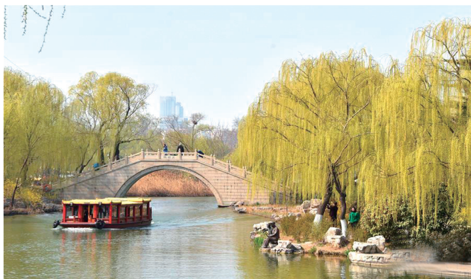
柳树被古人赋予离别、思乡、悼古等诸多意象，图为济南大明湖杨柳岸一景。

隋亡以后，唐代人发现扬州植柳的美景和地方风物非常和谐，并不以“杨”字为嫌，反而在扬州遍地植柳。杜牧说“街垂千步柳，霞映两重城”，通衢有柳；鲍溶说“柳塘烟起日西斜，竹浦风回雁弄沙”，池沼有柳；罗隐说“入郭登桥出郭船，红楼日日柳年年”，台榭有柳；郑谷说“扬子江头杨柳春，杨花愁杀渡江人”，江边有柳；李商