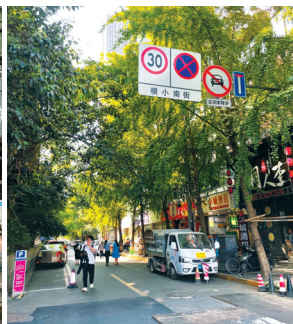
路口有明显的禁停标志。