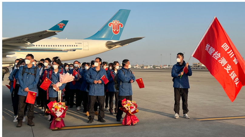
赴吉林市支援的队员们回家了。

据了解,此次四川省援吉林市核酸检测队共306人,分别于3月30日、31日从成都出发,支援吉林期间共计检测核酸样本近30万管。队员们都是从成都、泸州、攀枝花、德阳、广元、遂宁、内江、南充、达州9市选派的具备移动核酸检测方舱实际工作经验或有培训经历的检测人员和院感防控人