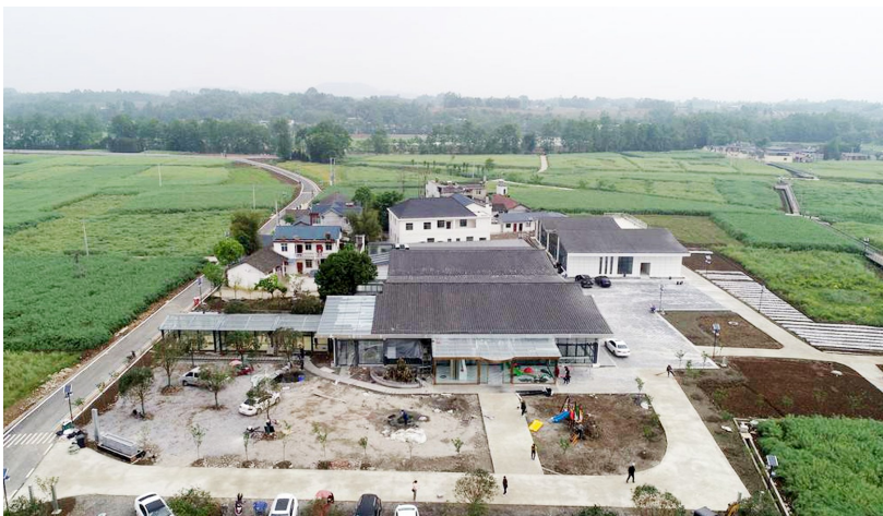
天竺村新建的接待大厅和培训中心。

4月18日,华西都市报、封面新闻记者走访秀水镇天竺村。这里的农业培训中心和宴会接待大厅已基本完工,有望在“五一”假期开门迎宾。