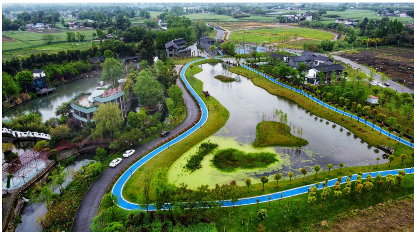
蒋家河湿地公园航拍。

按照一般的规划概念，湿地公园以湿地景观为基础，具备休闲观光功能。如今，许多城市都建设有湿地公