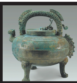
吴王夫差盃 春秋晚期