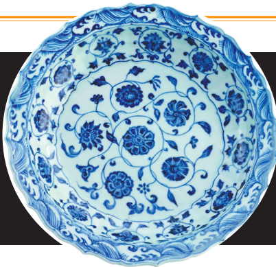
景德镇窑青花缠枝花卉纹盘 明