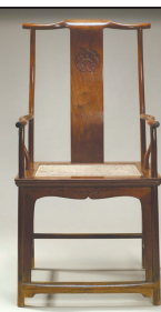
黄花梨四出头官帽椅 明