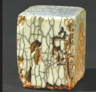
文影「七十二峰深处」 牙章 明