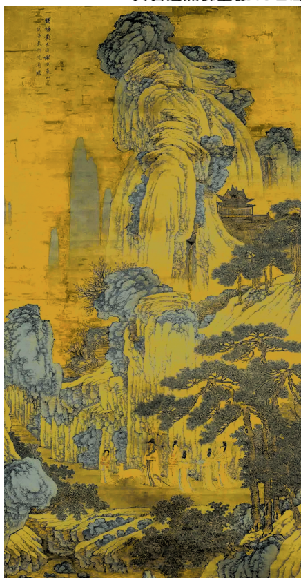
临懿文进谢安东山图轴 沈周 明