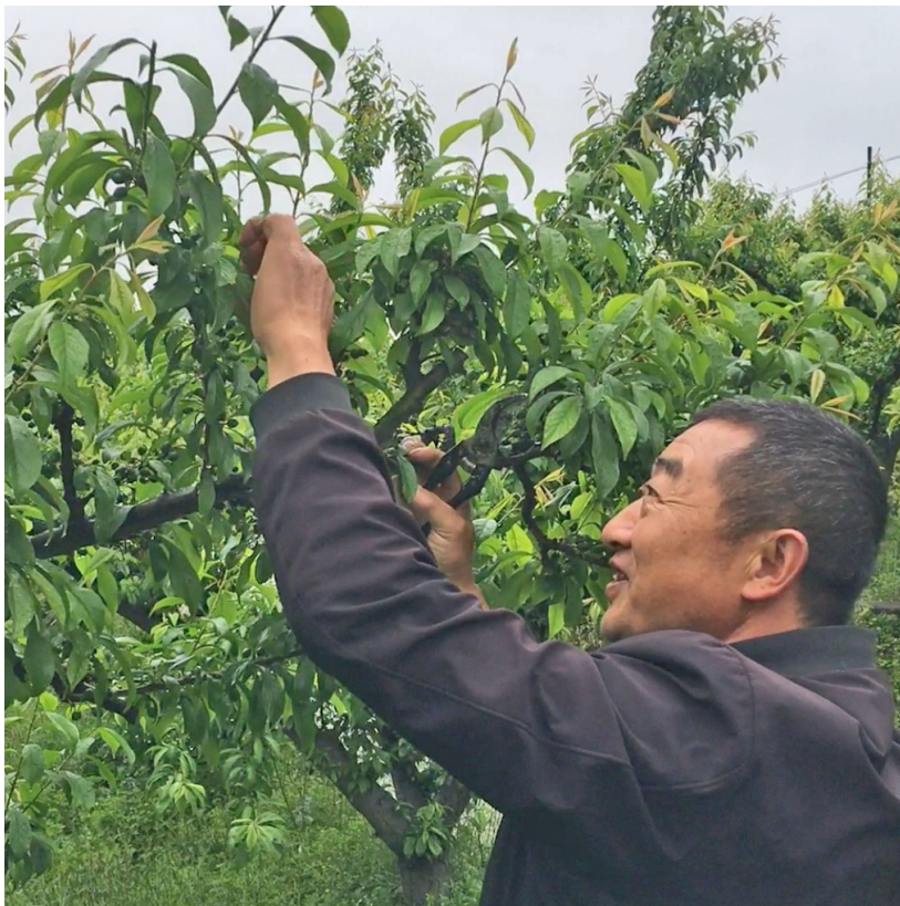
王朝训在为果树疏果。

疏果,就是在果子还小的时候,把树上长相不好、结得太密的果子给提前摘掉,留下大约三分之二的果子,这