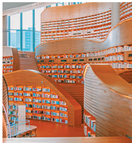
馆内的图书陈列方式犹如“书山”。