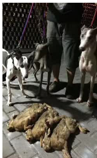
▲用猎狗狩猎到的野兔。