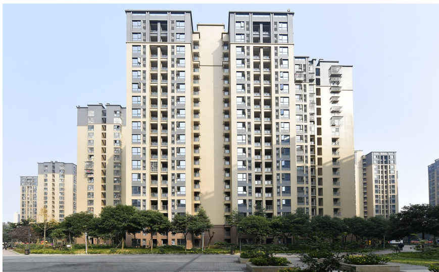
成都高新区南华佳苑保障性租赁住房项目今日正式“开租”。