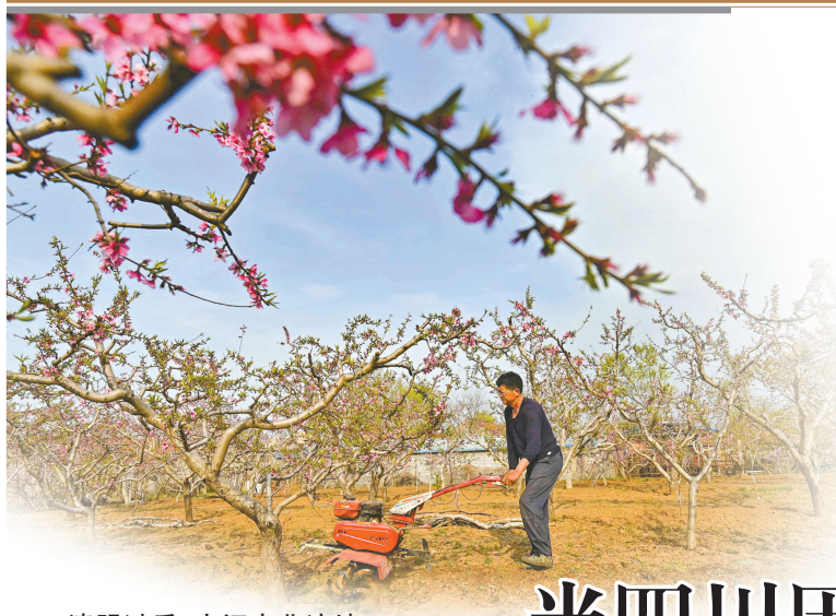
清明过后，大江南北遍地春，田间地头农事忙。

4月5日是清明。在四川历史名人中，包括李冰、李白、杜甫、薛涛、苏轼等，都留下了跟清明相关的文字和故事。其中，苏轼的行书代表作《黄州寒食诗帖》和《东栏梨花》中那句“人生看得几清明”，至今读起来仍余韵袅袅。