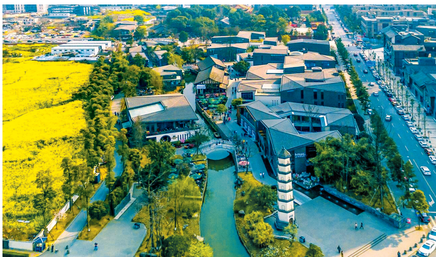
成都正建设践行新发展理念的公园城市示范区。