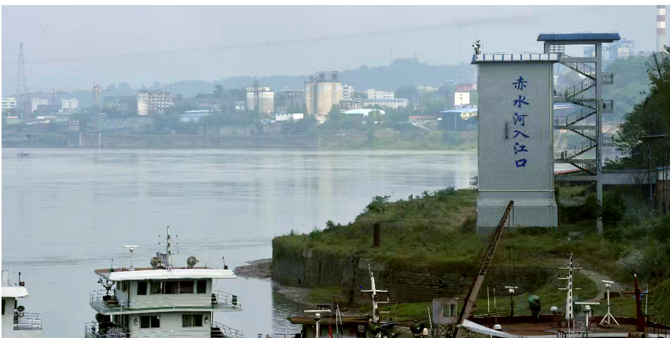
薄雾笼罩的合江县赤水河入江口(摄于2021年11月)。