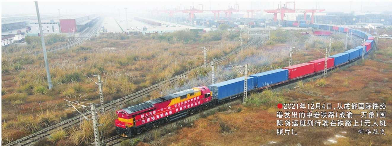
●2021年12月4日,从成都国际铁路港发出的中欧铁路(成渝—万象)国际货运班列行驶在铁路上(无人机照片)。

四川自贸试验区新设企业55635户,较上年同比增长24%;外商直接投资15.1亿美元,较上年同比增长69.7%;外商直接投资占全省比重由挂牌之初的4.3%提升到44.9%。