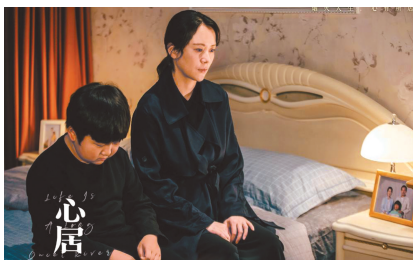
海清的表演层次感比较强。