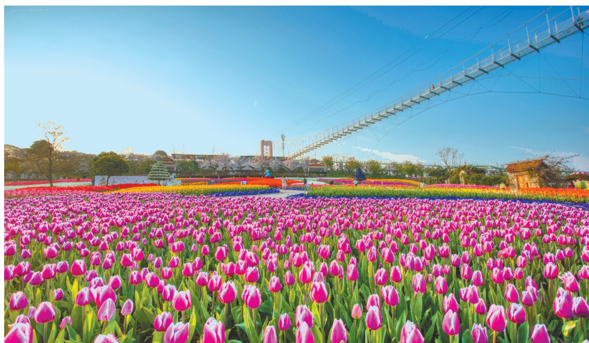
成都漫花庄园已是春花烂漫。