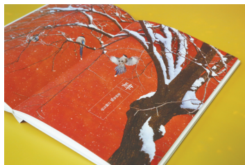
书中有大量精美珍藏图片。

间有些不知名的鸟雀在鸣叫，时光静溢得仿佛凝固了一般。恍然意识到，这已经是我在这座宫城里的第三十个秋天。”