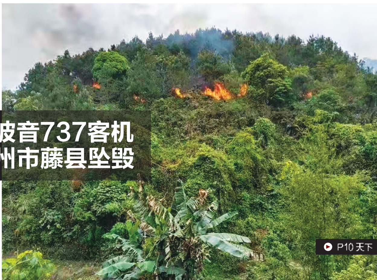
这是3月21日拍摄的藤县坠机事故现场周边画面(手机照片)。

21日16时15分，武警梧州支队与地方应急管理部门对接，派出30余名官兵携铁铲、救生绳、救援包等物资先期出发，于17时40分抵达救援现场，开展封控、搜救、清理现场等工作。