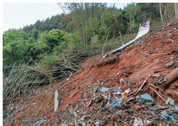
坠机现场发现的飞机残骸。