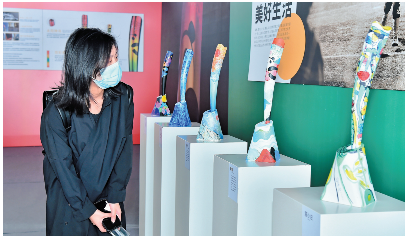
市民仔细端详以成都大运会火炬“蓉火”为原型的创意设计作品。

种技能，既可以变身“翻译家”，又可以担任“防疫监控员”，称得上是一专多能，充分展示了成都大运会绿色、智慧的特色。