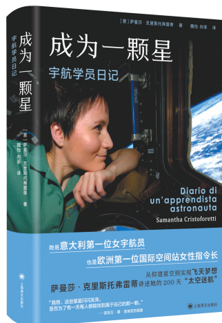
《成为一颗星：宇航学员日记》