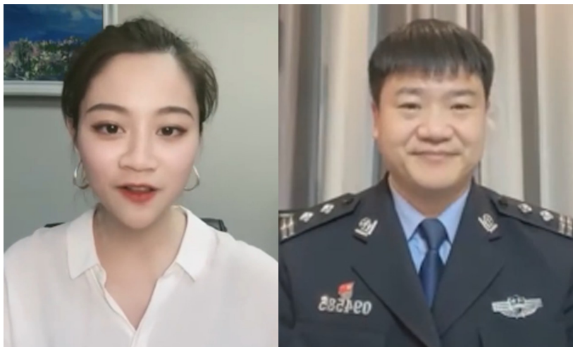
封面新闻微博直播间主持人(左)连线反诈民警老陈,教网友识破骗局。直播截图

随后，陈警官又给网友普及了“杀猪盘诈骗”“贷款诈骗”等诈骗类型。他说：“虽然很多诈骗类型大家都知道，但诈骗也在‘变异’。比如杀猪盘诈骗，在聊天交友过程中，对方可能会引诱你做一些不雅动作，等后期达不到目的后，就会利用这些不雅视频进行敲诈勒索，所以网上交友一定要慎重，首先要守住底线。所谓底线，第