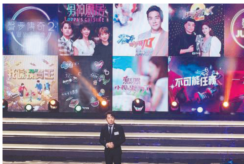
王祖蓝推介2022年TVB新综艺。