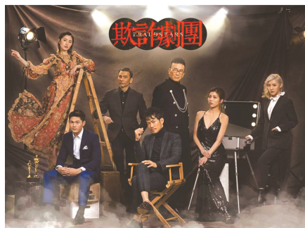
金牌监制潘嘉德回巢后首部作品《荒诞剧团》。