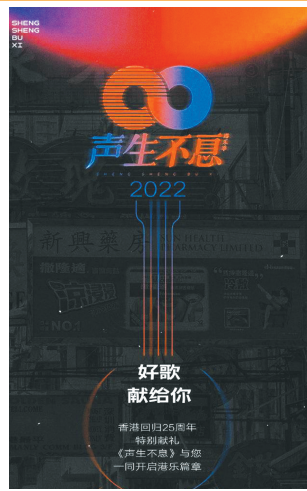
由TVB和芒果TV联合打造的综艺《声生不息》开播在即。