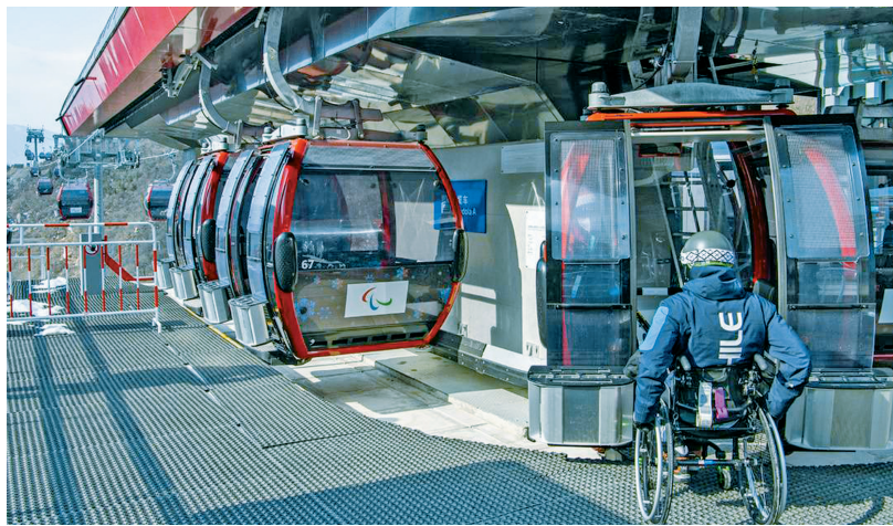
2月28日，运动员在国家高山滑雪中心准备乘坐缆车。

设施、信息、服务与观念等方面感受到了北京冬残奥会在无障碍环境打造上付出的巨大努力。罗德里格斯表示，除了硬件的无障碍之外，另一个重要奥运遗产就是文化和观念的无障碍，“让残疾人更加积极主动地融入社会，在这方面北京无疑给下一届冬残奥会的东道主设立了标杆”。